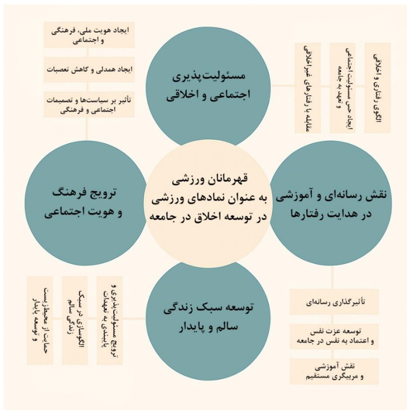
شکل ۱: مدل مفهومی پژوهش Figure 1: Conceptual model of the research