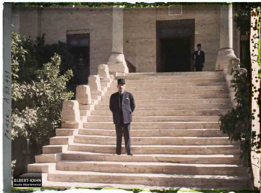
► تصویر ۳: عمارت الحاقی ارگ در شهر یور ۱۳۰۶ هـ.ش. Fig. 3: Annex building of the Arg in Shiraz, September 1927.